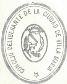
GERARDO RUSSO CONCEJAL Presidente Concejo Deliberante